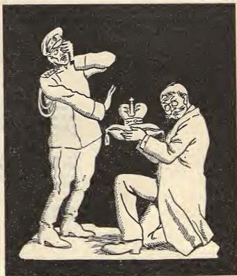
Михаил Романов и Милюков.